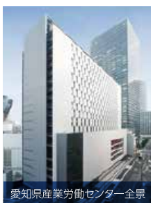
愛知県産業労働センター全景 (平成30年4月時点)